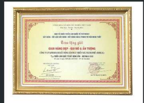
Hội Chợ Vietbuild Gian Hàng Đẹp - Qui Mô & Ấn Tượng Vietbuild's Fine , Large-Scale and Impressive Pavilion