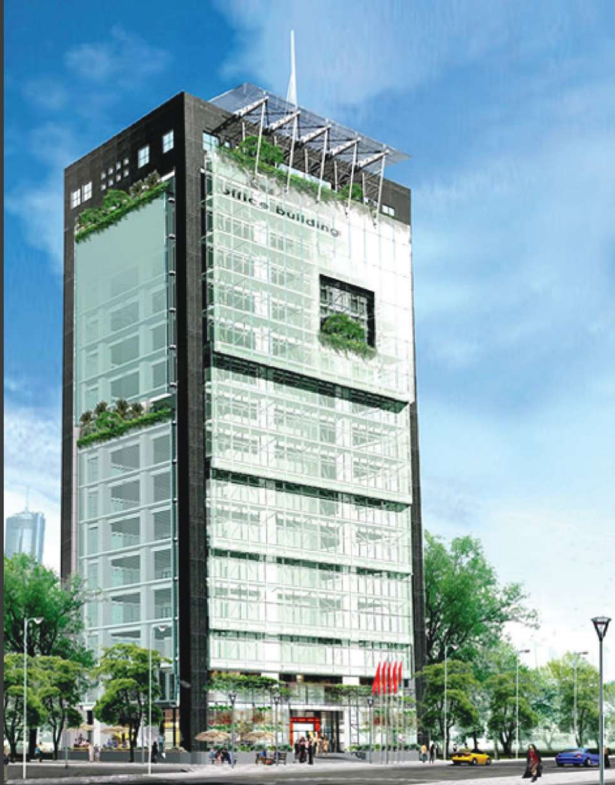
CAO ỐC VĂN PHÒNG 25 BIS NGUYỄN THỊ MINH KHAI 25 BIS NGUYEN THI MINH KHAI OFFICE BUILDING