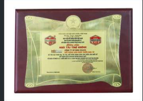
Nhà Tài Trợ Chính Hội Chợ Vietbuild Vietbuild's Major Sponsor