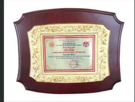
Cúp Vàng Thương Hiệu Ngành Xây Dựng - Bất Động Sản Real Estate - Construction Brand Gold Cup