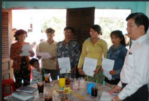
Trao Nhà Tình Nghĩa Presenting House Of Gratitude