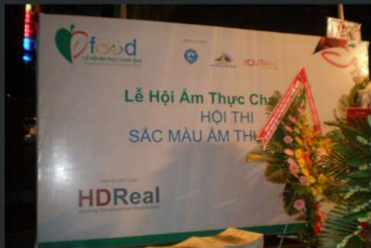
Tài Trợ Lễ Hội Ẩm Thực Chay Vegetarian Foods Festival Sponsorship