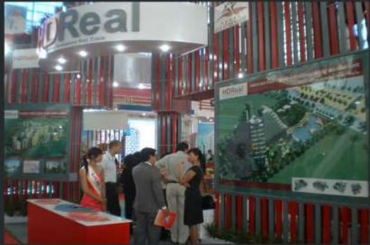
Hội Chợ Vietbuild Vietbuild Exhibition